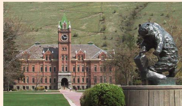
州立モンタナ大学 The University of Montana

米国モンタナ州への1学年間の交換留学を希望する高校生を対象とした奨学支援制度です。留学準備から帰国までフルサポート。奨学支援金は5万円。